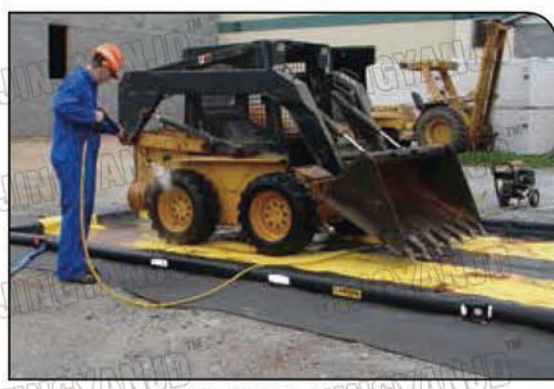
辅助设备冲洗以及水资源再利用。