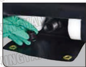
倾倒口方便盛漏盘快速排水。

注：选择托盘时，应预留空间：宽 8 英寸 (203mm) 长 36 英寸 (914mm)。