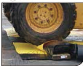
支撑板在车辆进出托盘时防止溢漏发生。