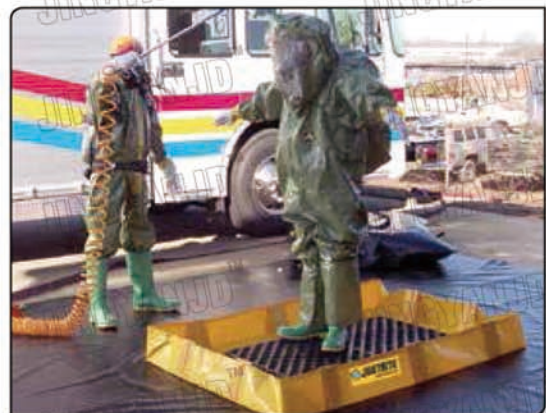
可用于人身沾染化学品后的紧急清洗。